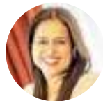
Morena Ileana Valdez Vigil Ministra Ministerio de Turismo (SAL)