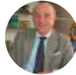
Ricardo Galindo Viceministro Viceministerio de Turismo (COL)