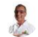
William Dau Alcalde Alcaldía de Cartagena (COL)