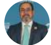
Sergio Díaz-Granados Presidente Ejecutivo Banco de Desarrollo de América Latina CAF