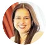
Morena Ileana Valdez Vigil Ministra Ministerio de Turismo (SAL)