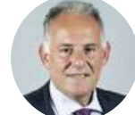
Roque Baudean Director Nacional de Turismo Ministerio de Turismo (URU)