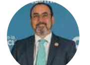
Sergio Díaz-Granados Presidente Ejecutivo Banco de Desarrollo de América Latina CAF