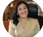
Sofía Montiel Ministra SENATUR - Secretaría Nacional de Turismo (PAR)