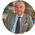
Ricardo Galindo Viceministro Viceministerio de Turismo (COL)