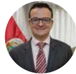
Gustavo Segura Sancho Ministro Instituto Costarricense de Turismo (CR)